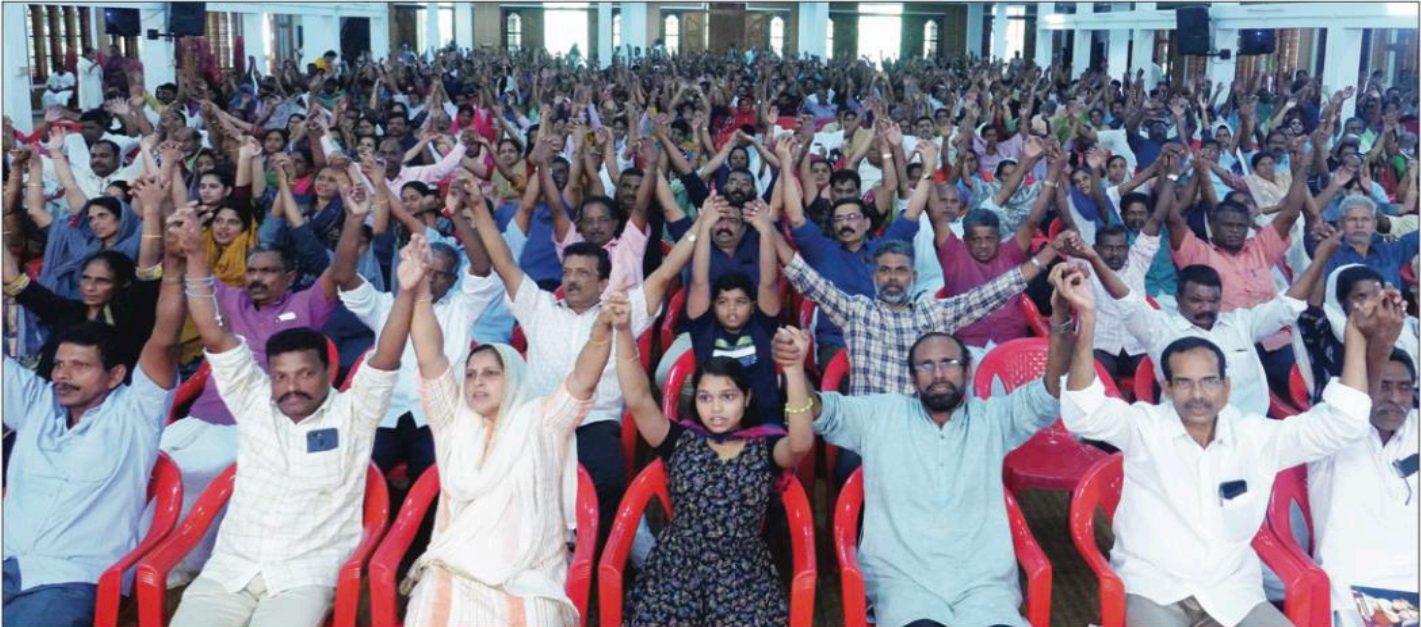
2023 ഡിസംബർ 1ന് നടന്ന അട്ടപ്പാടി സെഹിയോൻ ധ്യാനകേന്ദ്രത്തിലെ ആദ്യവെള്ളി കൺവെൻഷനിൽ നിന്ന് (വചന ഹാൾ ഉൾഭാഗം)